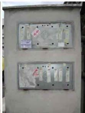
Via C. Maestrini 430