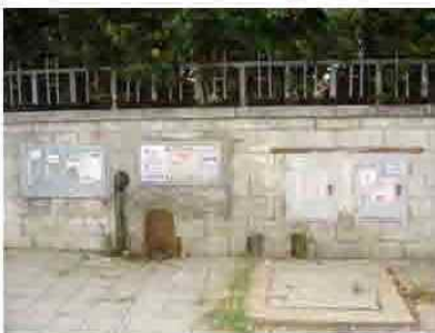
Via C. Maestrini 191 (sinistra)