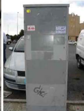
Via I. Versari 004