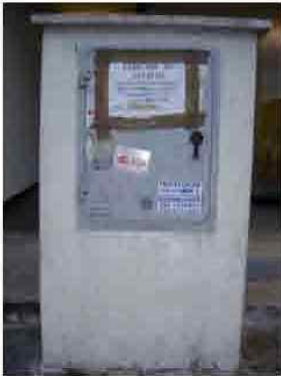
Via C. Maestrini 293

Sito web: www.viverein.org E-mail: associazione@viverein.org