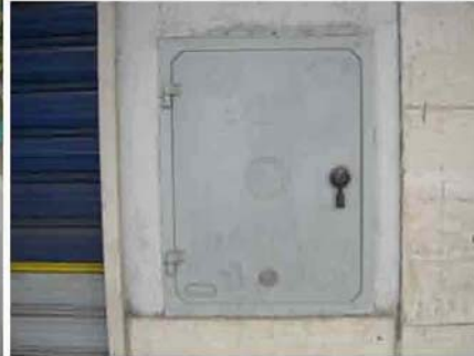
Via C. Maestrini 414