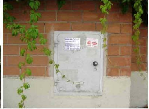
Via I. Versari 226