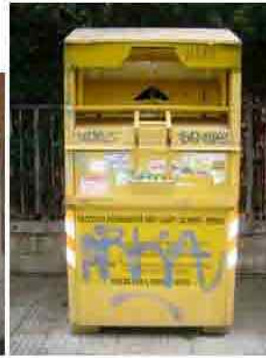
Via C. Maestrini 108