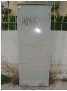
Via A.G. Micheletti 3