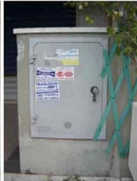
Via C. Maestrini 414 bis