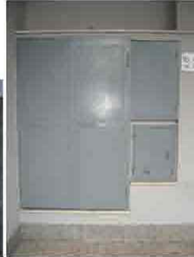
Via C. Maestrini 346