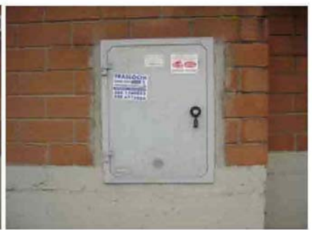
Via I. Versari 234