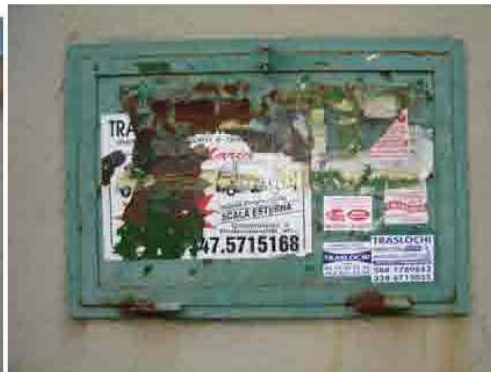
Via C. Maestrini 400