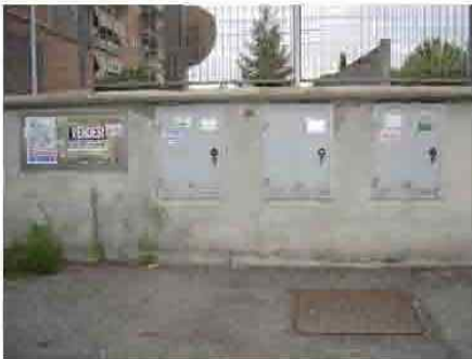
Via C. Maestrini 142