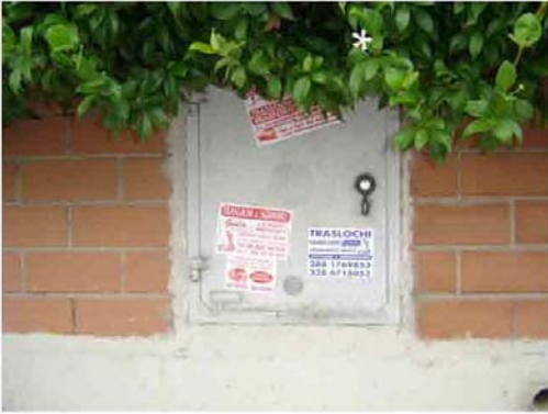
Via I. Versari 182

Sito web: www.viverein.org E-mail: associazione@viverein.org