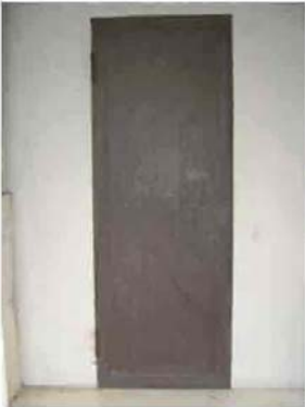
Via C. Maestrini 406

Sito web: www.viverein.org E-mail: associazione@viverein.org