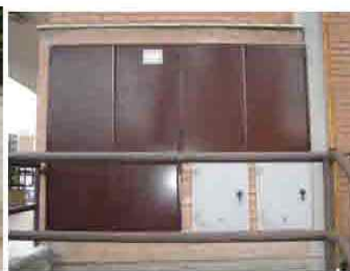
Via C. Maestrini 220