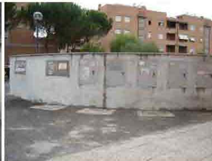
Via C. Maestrini 172