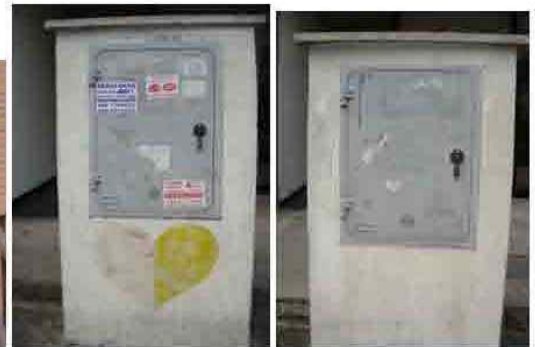
Via C. Maestrini 269 Via C. Maestrini 281