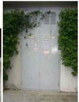
Via I. Versari 270