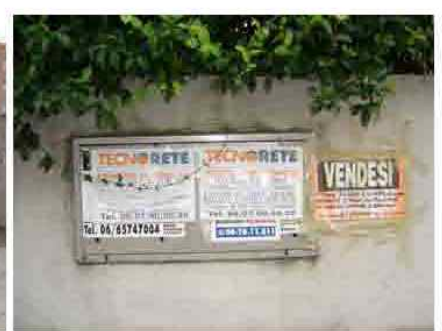
Via C. Maestrini 191 (destra)