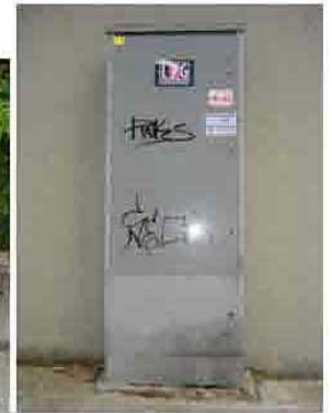
Via C. Maestrini 377