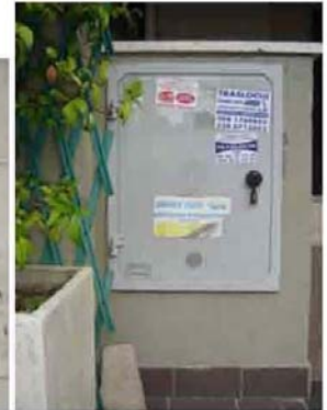
Via C. Maestrini 420 bis