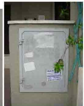
Via C. Maestrini 406 bis