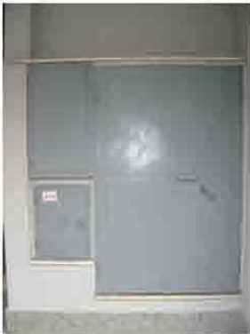
Via C. Maestrini 364