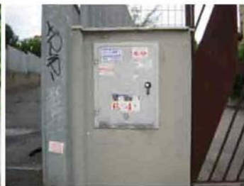
Via I. Versari 264