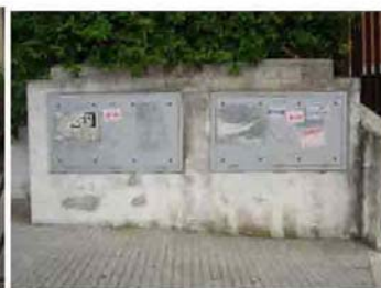
Via I. Versari 268