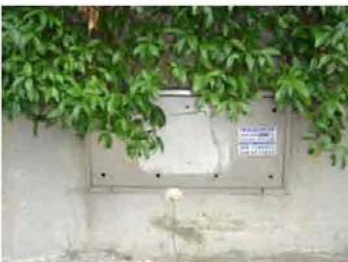
Via I. Versari 262