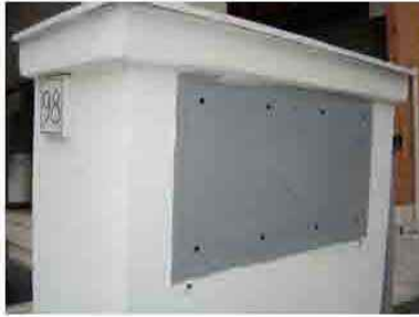
Via C. Maestrini 098