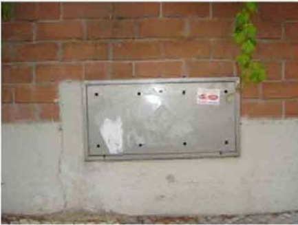
Via I. Versari 228