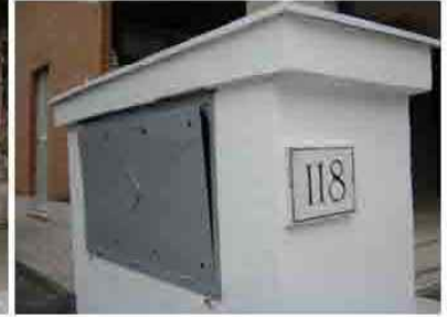
Via C. Maestrini 108