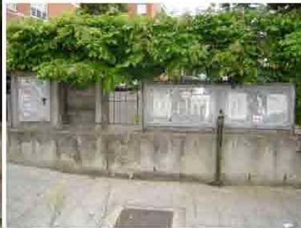
Via C. Maestrini 373