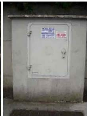
Via C. Maestrini 450