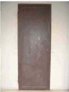
Via C. Maestrini 420