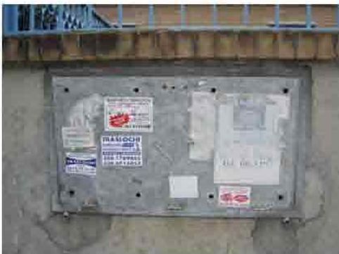
Via C. Maestrini 385