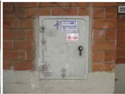
Via I. Versari 232