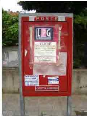
Via C. Maestrini 373