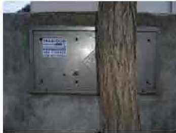
Via C. Maestrini 301