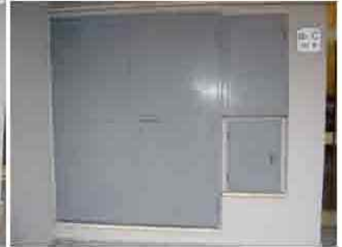
Via C. Maestrini 354