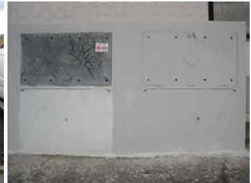
Via I. Versari 004