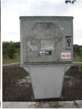
Via I. Versari 186