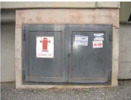
Via C. Maestrini 454